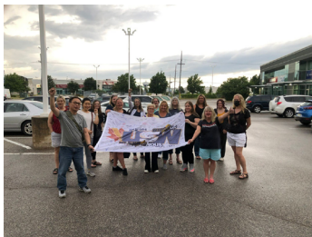
Unité 501 - Barrie, Clérical