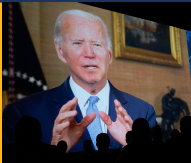
Joe Biden Président des États-Unis

Après cinq ans d'absence, nous avons été heureux de participer à nouveau au Congrès international du Syndicat des Métallos. Ce congrès est l'endroit où l'on établit nos politiques à l'aide de résolutions soumises par les Sections locales. C'est aussi là que des modifications à la constitution du Syndicat peuvent être faites. Cet événement réunit des milliers de délégués de partout en Amérique du Nord. Pendant le congrès, des invités de marque sont venus nous partager leur soutien.