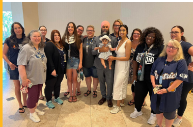
Un groupe des Femmes d'acier et le Chef du NPD Jagmeet Singh

Après cinq ans d'absence, nous avons été heureux de participer à nouveau au Congrès international du Syndicat des Métallos. Ce congrès est l'endroit où l'on établit nos politiques à l'aide de résolutions soumises par les Sections locales. C'est aussi là que des modifications à la constitution du Syndicat peuvent être faites. Cet événement réunit des milliers de délégués de partout en Amérique du Nord. Pendant le congrès, des invités de marque sont venus nous partager leur soutien.