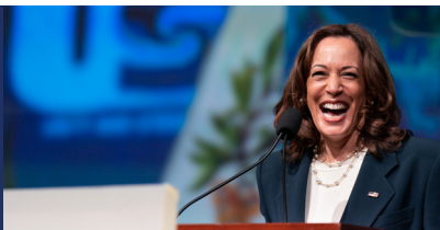
Kamala Harris Vice-Présidente des États-Unis