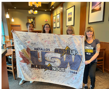
Unité 52 - New Westminister, Clérical et Opérateurs(trices)

Signez le Drapeau de Solidarité pour montrer votre fierté syndicale et votre soutien à la négociation. Restez à l'affût pour savoir quand le drapeau passera près de chez vous !