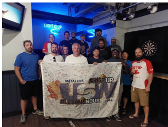
Unité 201 - Medicine Hat, Usine

Consultez https:// fr.usw1944.ca/ pour connaître le parcours du Drapeau de Solidarité et pour savoir quand il sera près de chez vous!