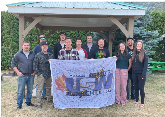
Unité 4 - Nelson, Usine