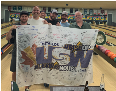
Unité 34 - Dawson Creek