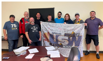
Unité 33 - Terrace, Usine

Signez le Drapeau de Solidarité pour montrer votre fierté syndicale et votre soutien à la négociation. Restez à l'affût pour savoir quand le drapeau passera près de chez vous !