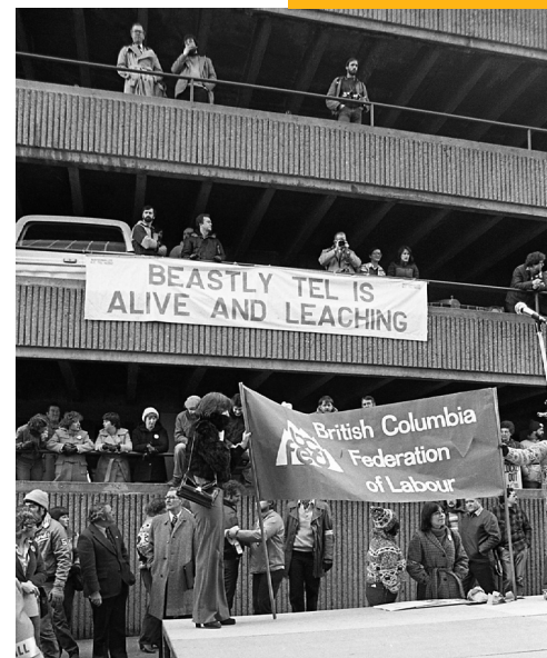
Manifestation devant les bureaux de la BC Tel, le 10 février 1981.