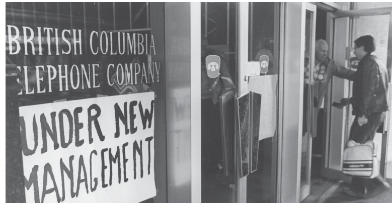
Occupation de l'édifice William Farrell de la BC Tel à Vancouver, le 6 février 1981.

À la suite de cette longue grève, la compagnie de téléphone a commencé à prendre des mesures pour améliorer le climat de travail.