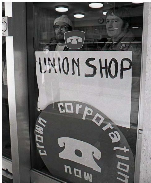
Les membres du STT occupant l'édifice William Farrell de la BC Tel, le 6 février 1981.