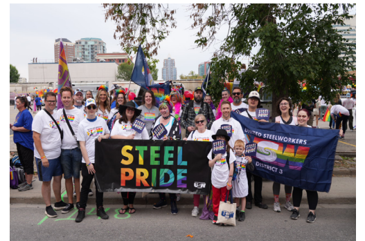
Steel Pride en pleine force et démonstration