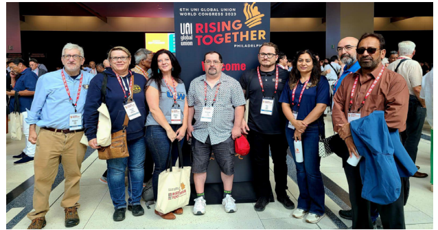
La délégation du Syndicat des Métallos participant au Congrès.