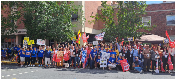
Les délégués d'UniGlobal se sont rendus dans le New Jersey pour soutenir le Syndicat des Métallos 4-200 en grève contre l'hôpital Robert Wood Johnson. Ils sont en grève pour la sécurité du personnel.